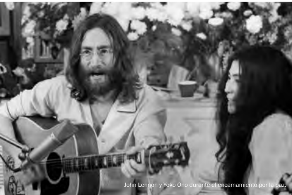
John Lennon y Yoko Ono durante el encamamiento por la paz.