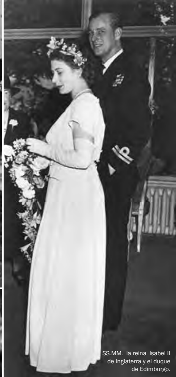
S.S.MM. la reina Isabel II de Inglaterra y el duque de Edimburgo.