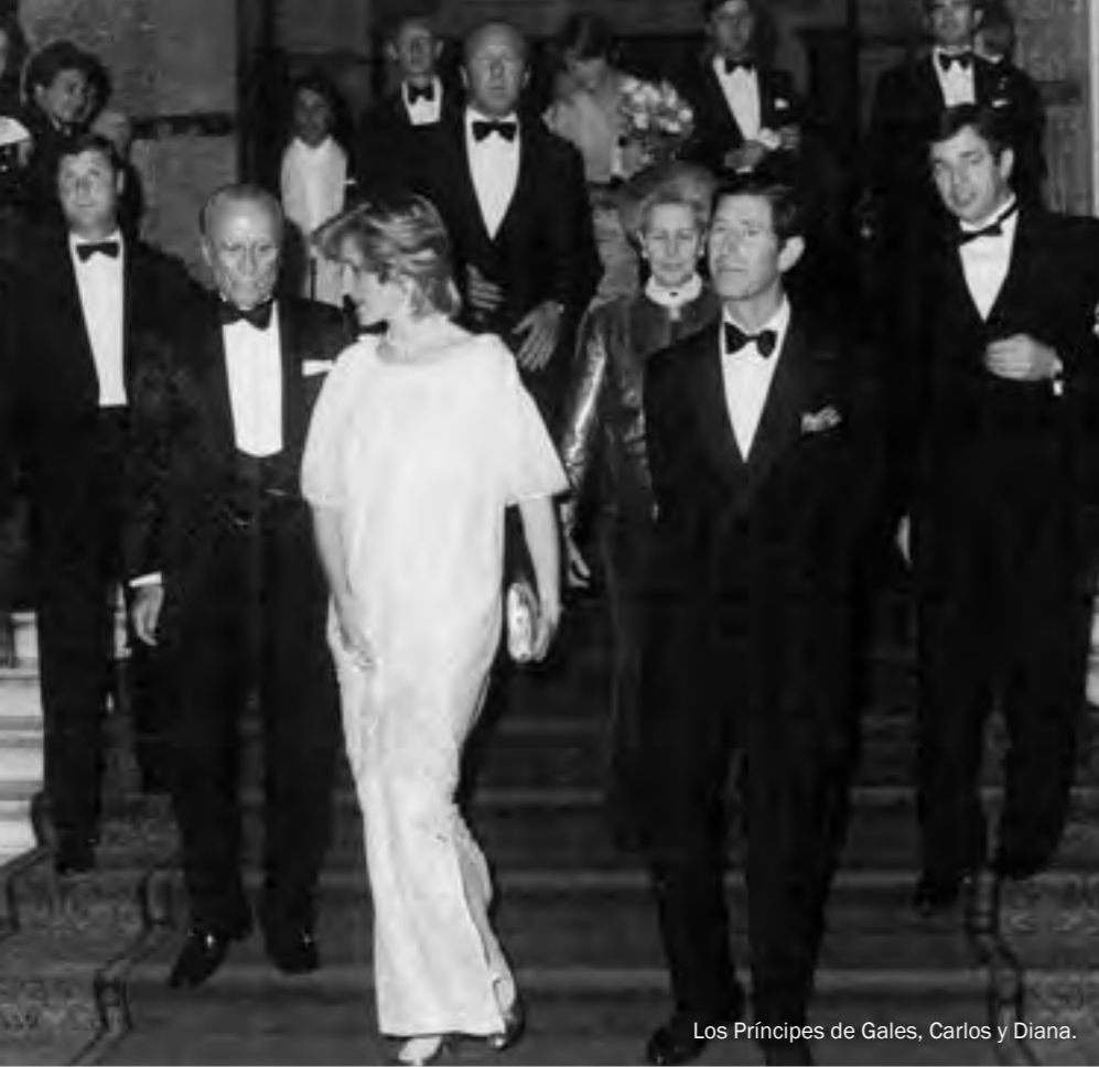
Los Príncipes de Gales, Carlos y Diana.