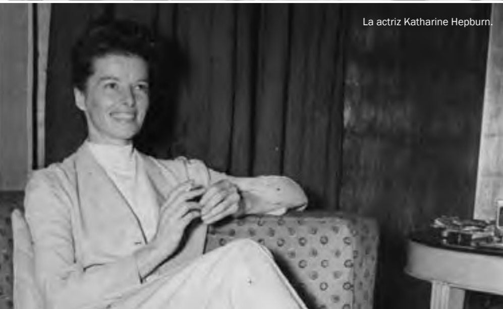
La actriz Katharine Hepburn.